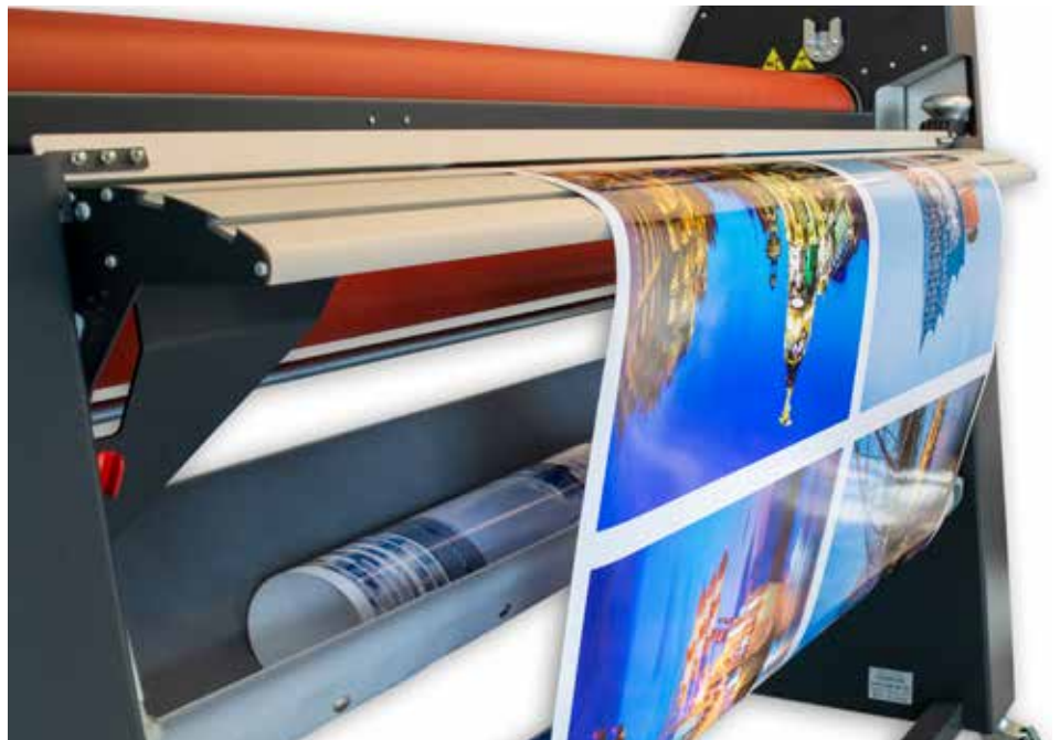
Rolle zu Rolle Laminieren