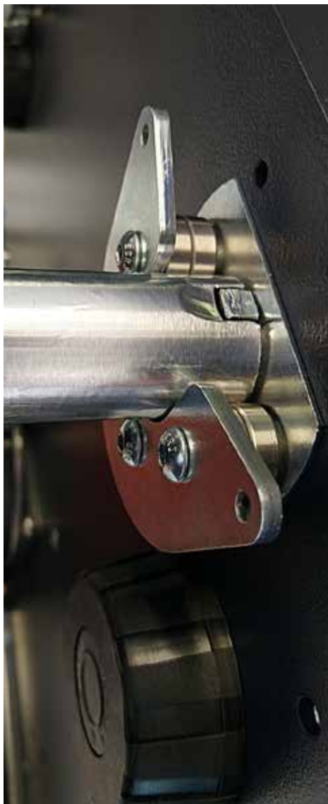
Antrieb über Bolzen-Nute-Verbindung