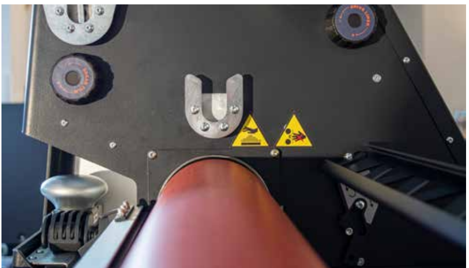
Separate Aufnahme für APP-Folie